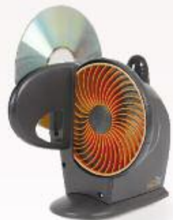
Intelligente Lösung für die Reparatur verkratzter Discs: der SkipDr. Premier.