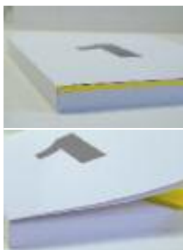
Die „Broschur in der Broschur“ berücksichtigt von Produktionsbeginn an Beilagen mit beliebiger Füllhöhe.

Leider geht diese Preisliste oft verloren, weil sie einfach lieblos „irgendwo“ zwischen den Katalogseiten lag. Auch Herausgeber von Geschäftsberichten mit separatem Image- und Zahlenteil oder Autoren von EDV-Installationsanweisungen mit unterschiedlichen Informationen für Administratoren und Anwender stehen häufig vor dem Problem, dass Beilagen ihrer Unterlagen verschwinden.